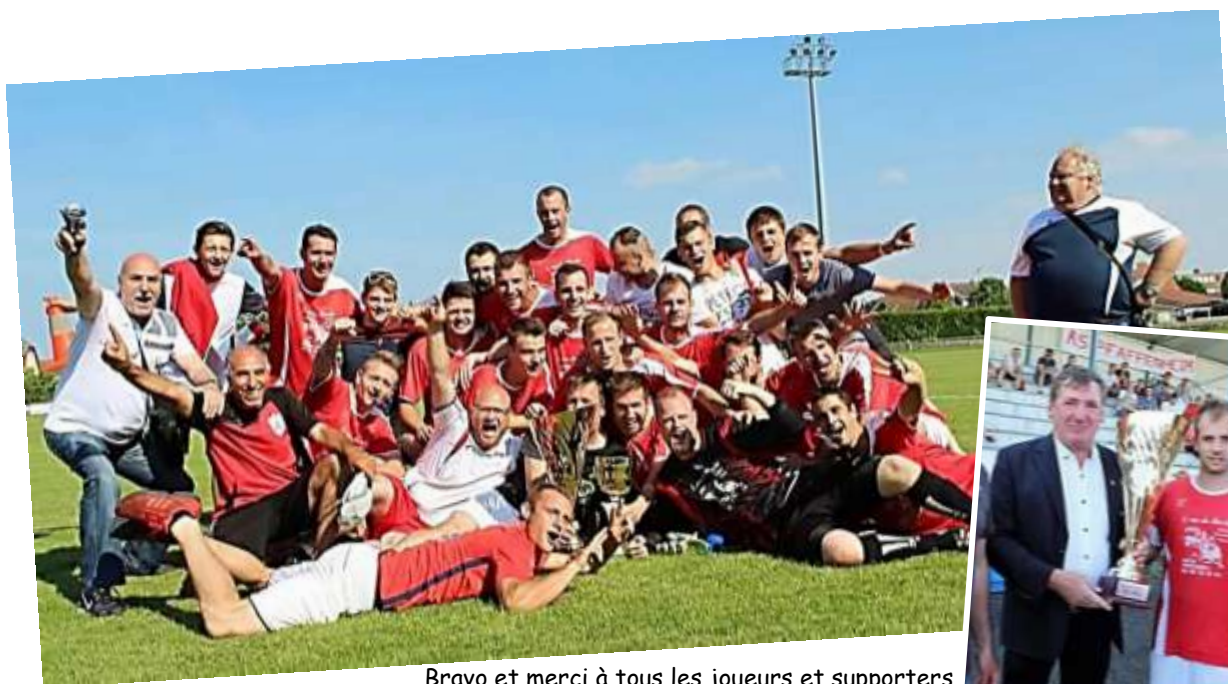
Bravo et merci à tous les joueurs et supporters qui ont participé et suivi notre équipe 2 tout au long de cette épopée !