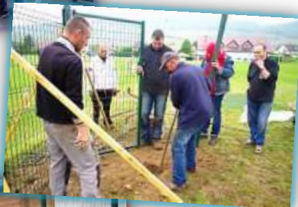
Grillage stade de football