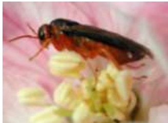
Hoplocampe des pommes (testudinea)

Description du ravageur : Selon l'espèce, l'adulte mesure entre 4 et 7 mm. La larve est de couleur blanc jaunâtre avec une tête brune.