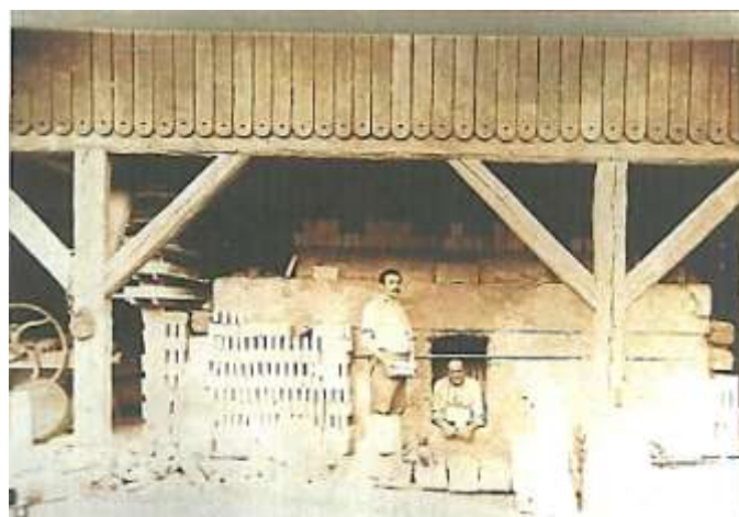
Le four à brique au début du 20ème siècle

Il se lança donc dans la réalisation de briques réfractaires utilisées pour la construction des chaudières d'usines. Et cela a marché ! Les commandes émanant des plus grandes usines en construction, aussi bien à Bâle, Strasbourg, Mulhouse, Colmar ou Guebwiller, se multiplièrent à Pfaffenheim, de sorte que Philippe Beck quitta la rue du Fossé pour s'installer dans la rue de la Chapelle.