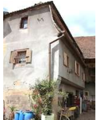
Première maison des Beck (17 ème siècle)

Ils se sont installés rue du Fossé (Maison Kuentz Romain) et y ont érigé leur demeure au-dessus de l'atelier de fabrication des creusets. Monsieur Kuentz a mis au jour l'ancien puits qui alimentait à la fois la cour et l'atelier.