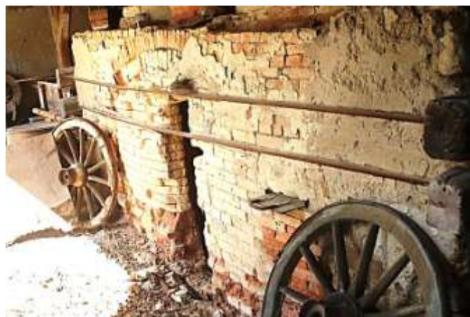
Le four tel que l'on peut le voir aujourd'hui