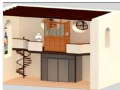
Schéma du projet d'installation de l'orgue sur une tribune au fond de la chapelle, au-dessus de la porte principale