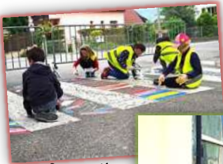
Passage piéton devant l'école