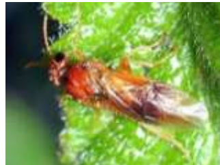
Hoplocampe commun ou jaune des prunes (flava)