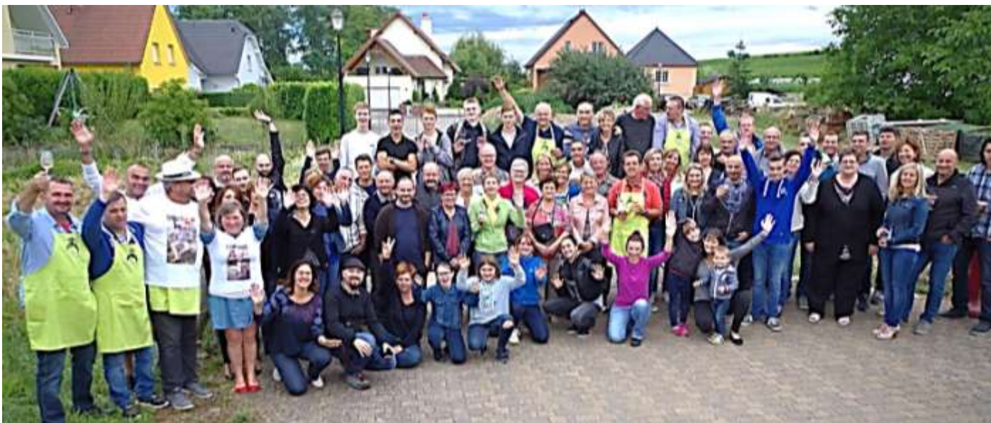
Soirée brochettes pour le quartier Nord, le 1er juillet