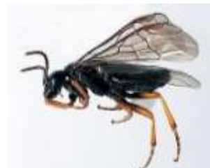
Hoplocampe noir des prunes (minuta)

Biologie : Le cycle biologique est assez semblable pour les différentes espèces. Le vol commence peu avant la floraison et se termine un peu après. A l'aide de sa tarière en forme de scie, la femelle pond ses œufs dans le réceptacle de la fleur à la base des pétales. Chaque femelle pond environ 50 œufs. Les larves éclosent après 6 à 18 jours d'incubation. Elles pénètrent dans les fruits, pour en ronger l'intérieur. Une même larve peut attaquer jusqu'à 5 fruits. Après 3 à 4 semaines la larve adulte quitte le fruit pour s'enfoncer dans le sol de 5 à 10 cm de profondeur. Elle se nymphosera au printemps suivant. Il n'y a qu'une seule génération par an.