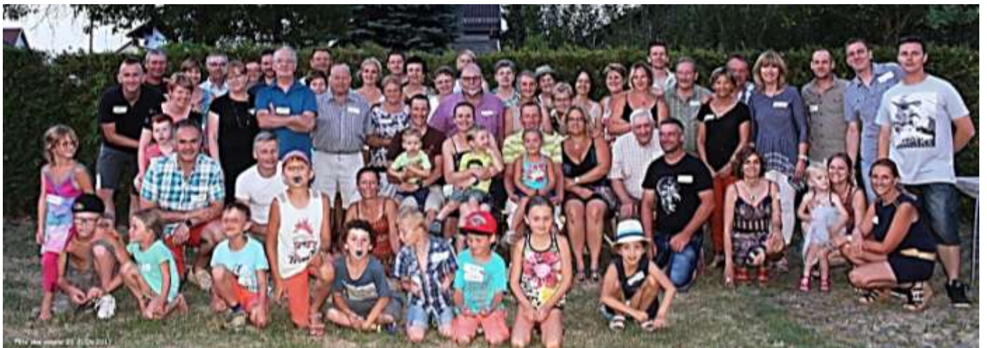
Paella géante pour la rue de la Lauch, le 23 juin