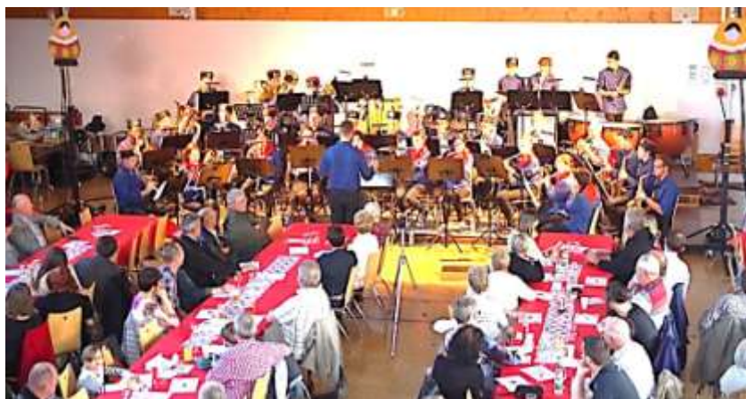
Le concert de printemps 2017 : Une belle réussite