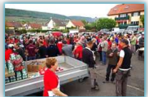
Rassemblement pour le repas

Mention spéciale aux ados. Grâce à eux, l'entrée de notre village est désormais haute en couleurs, ainsi qu'aux plus jeunes qui ont su détourner le passage piétons devant l'école pour en faire une œuvre d'art !