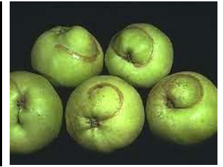
Sillon liégeux sur pomme

Lutte : Les hoplocampes sont attirés par le blanc lumineux. Les pièges englués de forme cylindrique (petit seau), plus efficaces que les plaques, sont à accrocher dans les arbres à 1,80 m du sol une dizaine de jours avant le début de la floraison. Ces pièges n'étant pas sélectifs, il est recommandé de les enlever à la fin de la floraison pour éviter de détruire trop d'insectes utiles. Cependant, lorsque la floraison a été abondante et que le nombre de fruits par arbre est important, une faible attaque d'hoplocampes constitue un éclaircissage naturel acceptable.