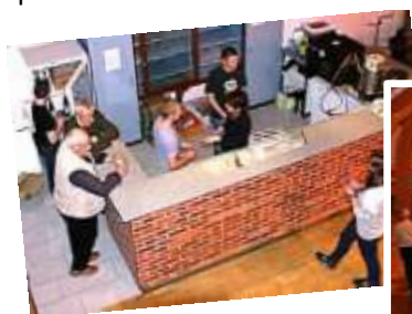
Salle comble pour notre "soirée asperge"