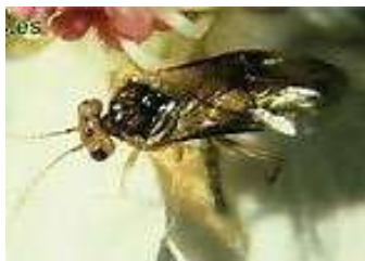
Hoplocampe des poires (brevis)