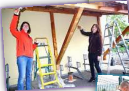
Peinture abri à vélos à l'école