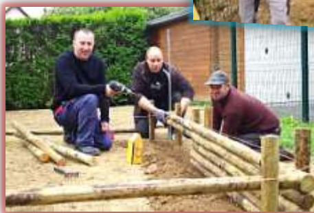
Travaux à l'école