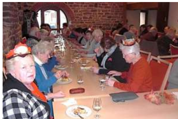
Illusion ou réalité, serons-nous les rois ou les Reines durant cette nouvelle année ?