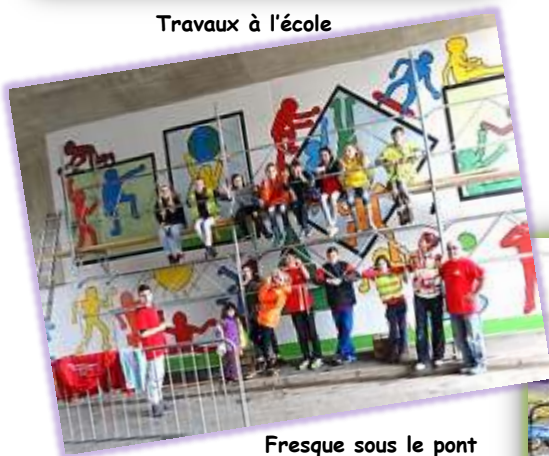
Fresque sous le pont