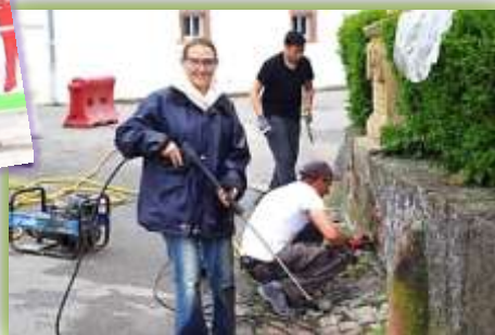
Square Dominique Braun