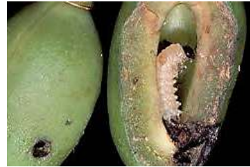
Dégâts sur prune

Dégâts : Sur les pommiers, les jeunes larves creusent des galeries sous l'épiderme des jeunes fruits. Au moment de la récolte, ces galeries forment des sillons à l'aspect liégeux. De manière générale, les fruits attaqués par les larves plus âgées présentent un trou arrondi qui donne accès à une cavité remplie d'excréments humides. La larve et ses crottes dégagent une odeur de punaise. Les fruits véreux cessent de croître et chutent.