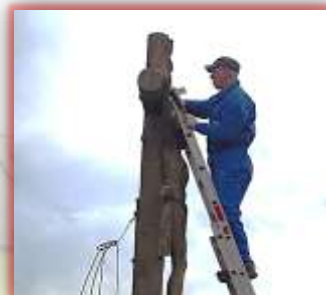
Calvaire square D. Braun

Lorsqu'on entend le mot individualisme, les journées citoyennes organisées dans plus de 1000 communes, prouvent le contraire. Sourires, convivialité, solidarité, partage étaient les maîtres mots de cette magnifique journée (la pluie n'a entaché en rien votre belle énergie !)