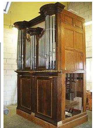
L'orgue actuellement en restauration dans les ateliers Hubert Brayé