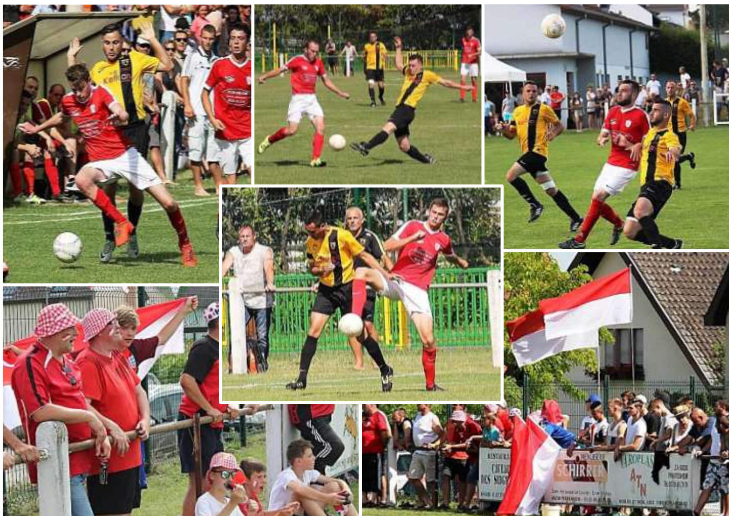
Une ferveur exceptionnelle pour cette finale !