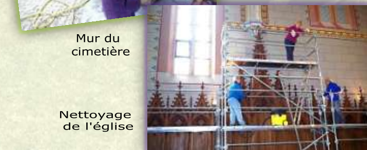
Mur du cimetière